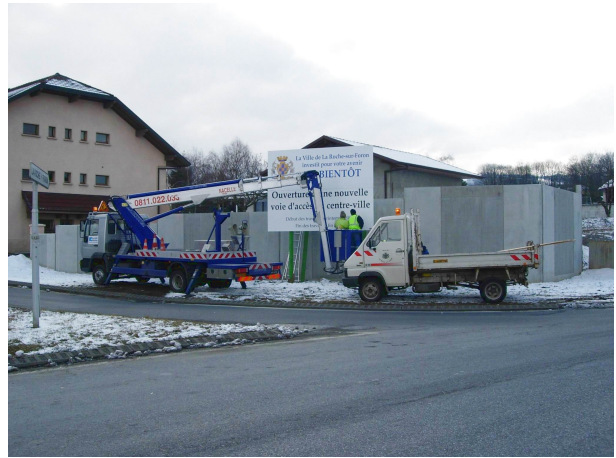
Vue du nouveau tronçon depuis le rond-point

Printemps 2005 Début des travaux d'aménagement