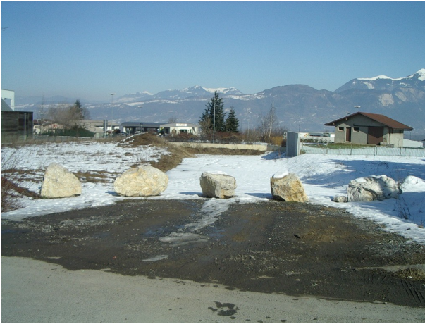
Vue du nouveau tronçon depuis la rue de la Goutette